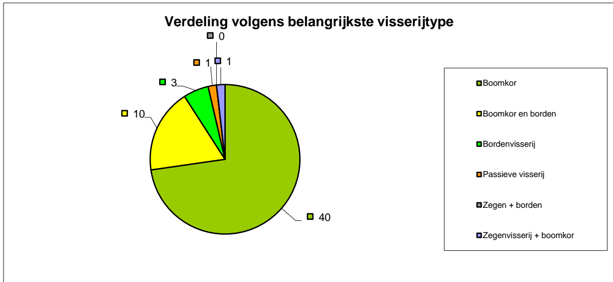
Grafiek 1: Verdeling vissersvaartuigen volgens belangrijkste visserijtype

Grafiek 1 toont aan dat ongeveer 73% van de leden van de Rederscentrale enkel vistuigen gebruikt die onder de categorie ‘boomkor’ vallen.