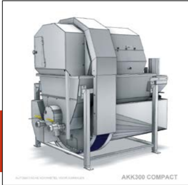
AUTOMATISCHE KOORNTEL VOOR LARVEN AKK300 COMPACT

Machiefabriek Kramer BV Oostzeedijk 4a 4486 PN Colijnsplaat Tel. +31 (0)113 693010 info@kramermachines.nl www.kramermachines.nl