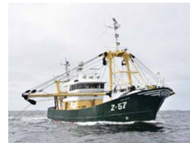
Voormalige Z.575 omgenummerd naar Z.57