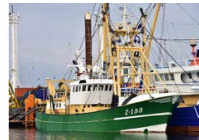
Voormalige Z.188

De voorbije weken was Hoekman Shipbuilding in Urk volop in de weer om het schip visserij-klaar te maken. Zowel het dek als het visruim moesten volledig vernieuwd worden. Ook krijgt de N.88 een nieuwe schilderbeurt. Verwacht wordt dat het vaartuig nog voor de zomer operationeel zal zijn.