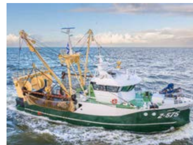
Nieuwe Z-575

Halverwege maart 2025 kon de Z.575 eindelijk haar eerste reis aanvatten. Vanuit IJmuiden zette ze koers naar het Kanaal, waar de bemanning een succesvolle eerste visweek kende. De vangst werd nadien gelost in de havens van Oostende.